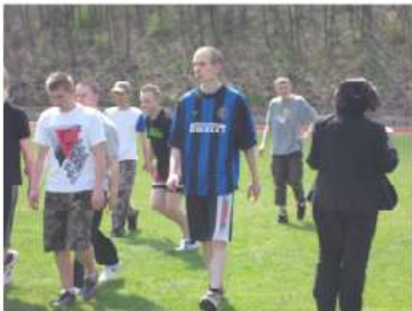
... geschlagen. Die Bedingungen waren nicht optimal