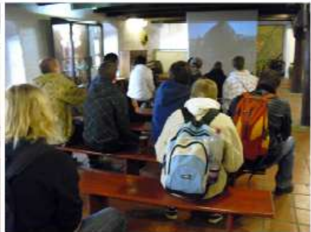
Ein Video über die böhmische Brauereikultur ...