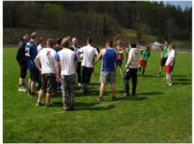
Die letzten Probleme werden beseitigt.