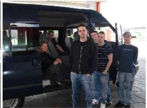
an der „Tanke“, endlich mal strecken