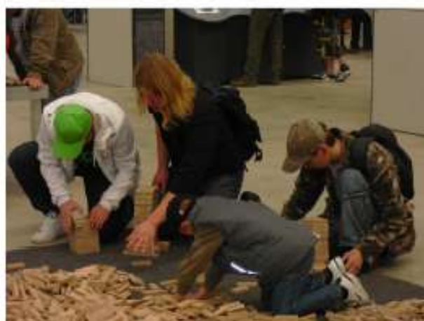
Wenn Metalller & Schweißer von Kindern lernen ...