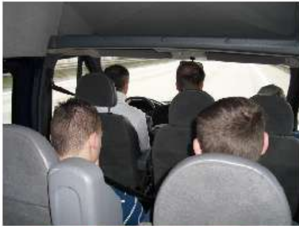
hüpf, ... hüpf, ... hüpf und noch 'ne Straßenfuge