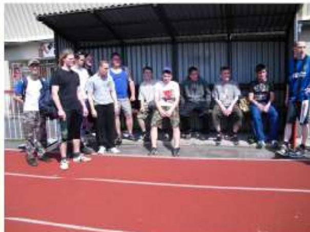
Die Nauener & Bautzener Gruppe