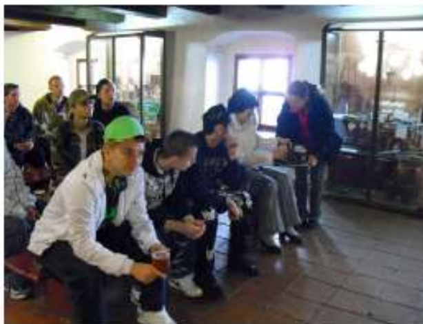
... genießt man bei einem entspannenden Bierchen.