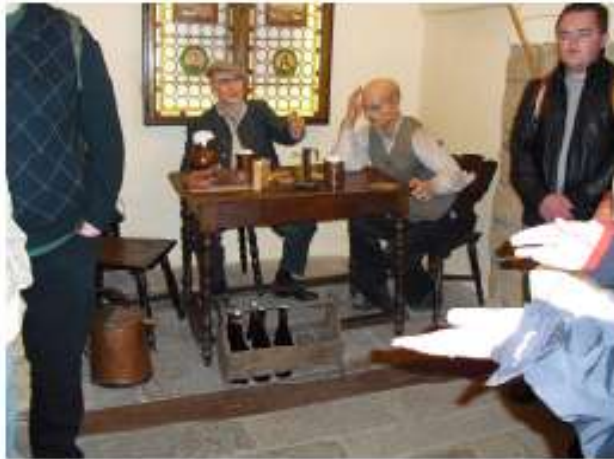
Das berühmte Pilsener Biermuseum