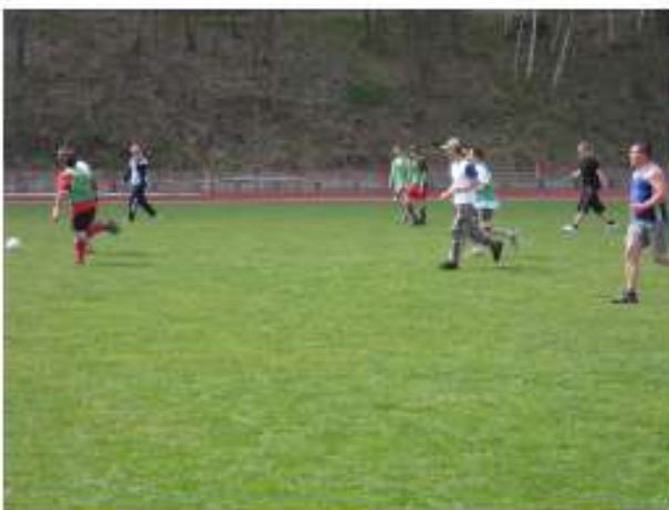
... 11:1 ; 12:1 unsere Hallenschuhe sind einfach zu glatt