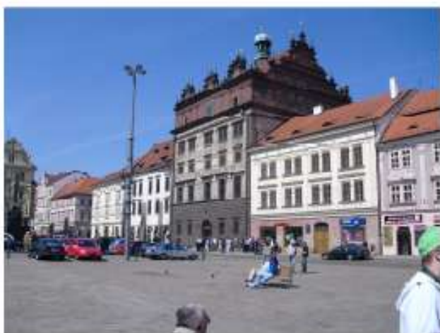
Rathaus in Pilsen ...