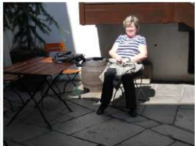
In der Zwischenzeit lässt es sich Dasa gut gehen!