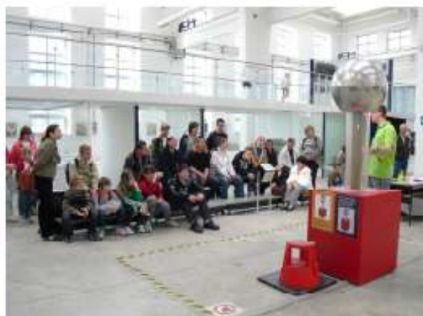
... mit physikalischem Demonstrationsprogramm