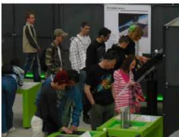
... im „Top Secret“ Bereich