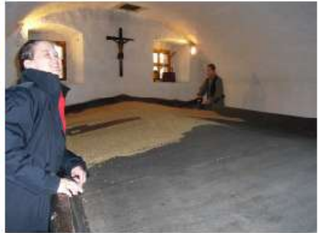
... hier wurde die Gerste & der Hopfen gesäubert