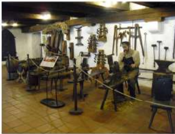
Ein Böttger bei der Herstellung eines Bierfasses.