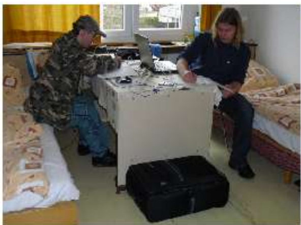
... auspacken kommt später, erst wird am PC gezockt!