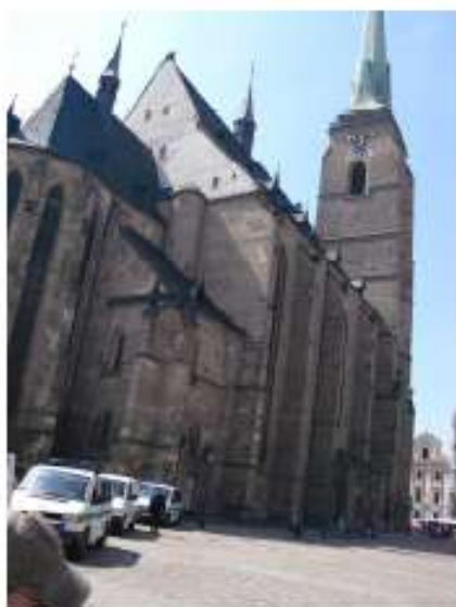
... mit seiner Kirche