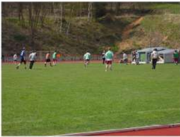
1:0 ; 2:0 ; 3:0 ..., haben wir überhaupt ein Konzept?