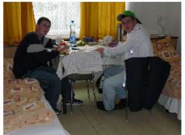
... kein Computer, das ist 'ne Strafe!