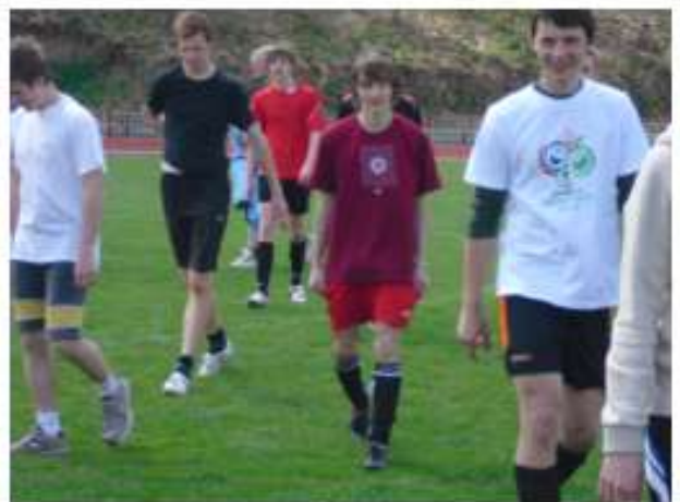
... 15:1 die Tschechien hatten „eingesackt“