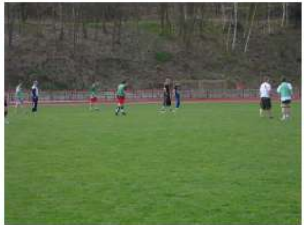
... 6:0 ; 7:0 ; 7:1 , man die spielen einfach nur frech!