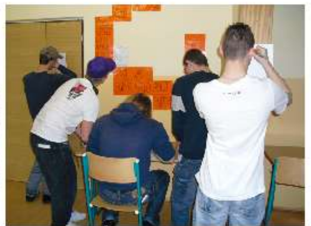
erstes tschechisches „WTRR-WARR“