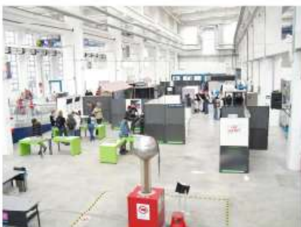
Technikmuseum in Pilsen