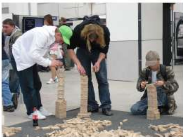
... können nur Großprojekte entstehen!