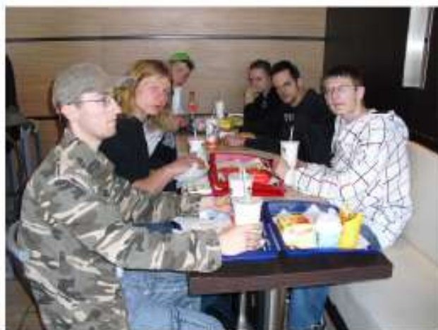
Kommentar eines Azubis: ... ich möchte bei McDonald's endlich wieder etwas „deutsches“ essen!